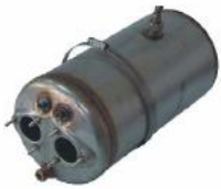
Build in boiler

The DW1/1 dishwasher is middle size, compact and highly efficient. I deal for restaurant of not over 200 seats. The DW1/1 dishwasher is made of quality stainless steel. All the components in contact with water are made of a comosion-resistant material. With jets which rinse jets permanently cover all the dish, it is much superior to any rotating system in washing quality and avoiding incrustations. The door safety switch will stop the washing in case of accidental opening of the door. Rinsing even the dishes placed at the end of trays. With water temperature at 85° C, it is impossible the drying and guarantees the elimination of a large percentage of bacteria and gems of steward brand. Then the machine still have the mediamat system shall be have your save washing system by higher and ensure chose please find steward.